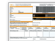
P2320 verzendformulier voor RoW1 en RoW2 (is tevens douaneverklaring)

Handtekening voor ontvangst. Retourservice en UitklaringsService optioneel.