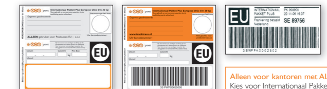
P2329 (EU zegel postbussen)